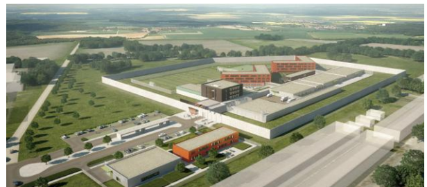
Animation: Plan2, München